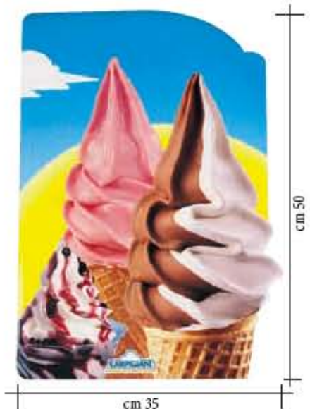
Doppelseitige Glasaukleber Softeis